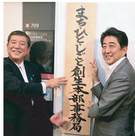
【地方創生政策策を打ち出す まち・ひと・しごと創生本部を 立ち上げた安倍総理と石破大臣】

逗子では、商工会が東日本大震災後の復興支援と地域活性化を掲げ、平成23年10月に総額2億2千万円分の逗子市Wプレミアム商品券を発行した。Wの意味は、10%プレミアムと抽選券（東北被災地商品プレゼント）である。プレミアム分の2千万円は逗子市から補助を受けて実施した。2回目は、1回目の商品券があまりにも好評であったために平成24年11月に実施したが、市からの補助が得られなかったために規模を縮小し、総額2千2百万円分の発行に留まり、10%のプレミアム分の2百万円は商工会が負担した。今回は国からの支援を確保出来そうだと、お知らせしたら真っ先に面会を求め、今後どのように展開していくか、協議したのは逗子商工会であった。逗子でも今回は、1万円が《ウラ面へつづく》